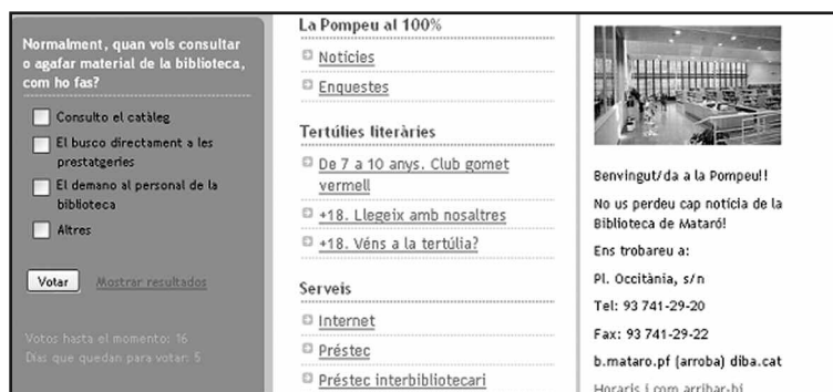
Figura 1. Ejemplos de gadgets incluidos: encuestas, menús, imágenes y enlaces