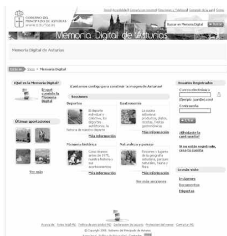
Ilustración II. Página de inicio de la Memoria Digital de Asturias

La página de inicio del portal de Memoria Digital se corresponde con la que se muestra a continuación: