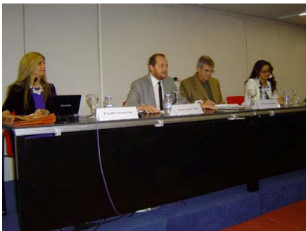
Mesa redonda FESABID LIBER 2009 (Madrid, 09-10-2009)