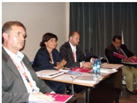
Asamblea General Ordinaria (Zaragoza, 20-05-2009)

La Asamblea General de la Federación se reunió en Zaragoza, en sesión ordinaria el 20 de mayo de 2009. En el Orden del Día se trataron los siguientes temas: 1. Lectura y aprobación, si procede, del acta de la Asamblea General Ordinaria celebrada el 13 de diciembre de 2008. 2. Informe de la Junta Directiva. 3. Aprobación definitiva, si procede, del balance y liquidación de cuentas del ejercicio 2007. 4. Presentación y aprobación, si procede del balance y liquidación de cuentas del ejercicio 2008.